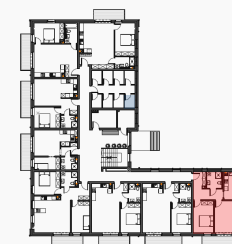
Lokalizacja mieszkania - piętro 1