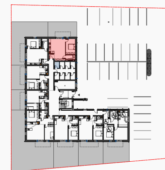
Lokalizacja mieszkania - parter